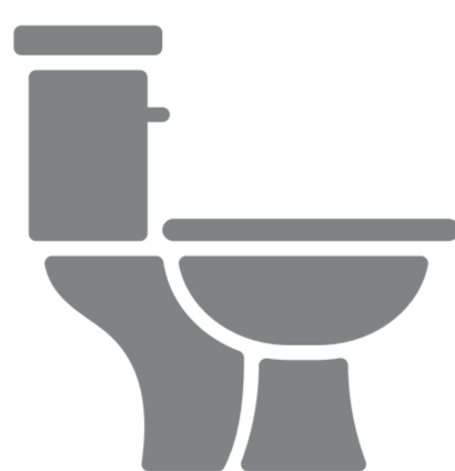
Ir al baño